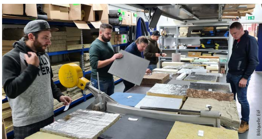
Abb. 4: TIPCHECK Training: Dämmstoffmemorie – verschiedene Dämmstoffe erkennen